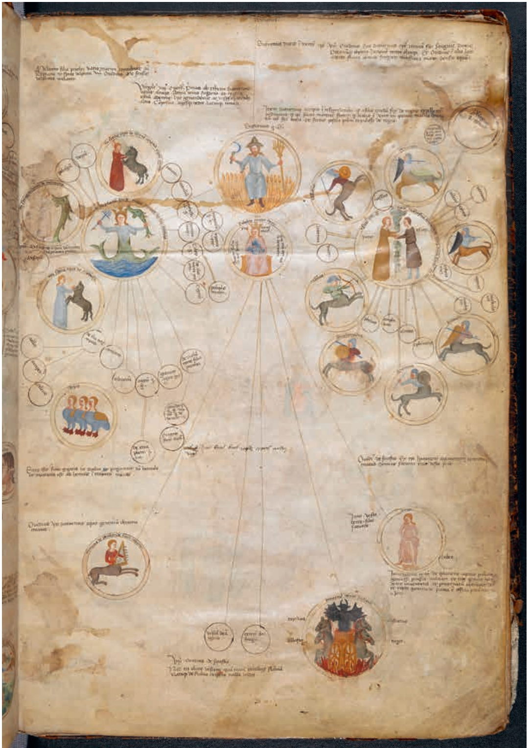
Abb. 5 Paolo da Perugia, Diagramm zu Saturn, London, British Library, Cod. Add. 57529, fol. 3r.