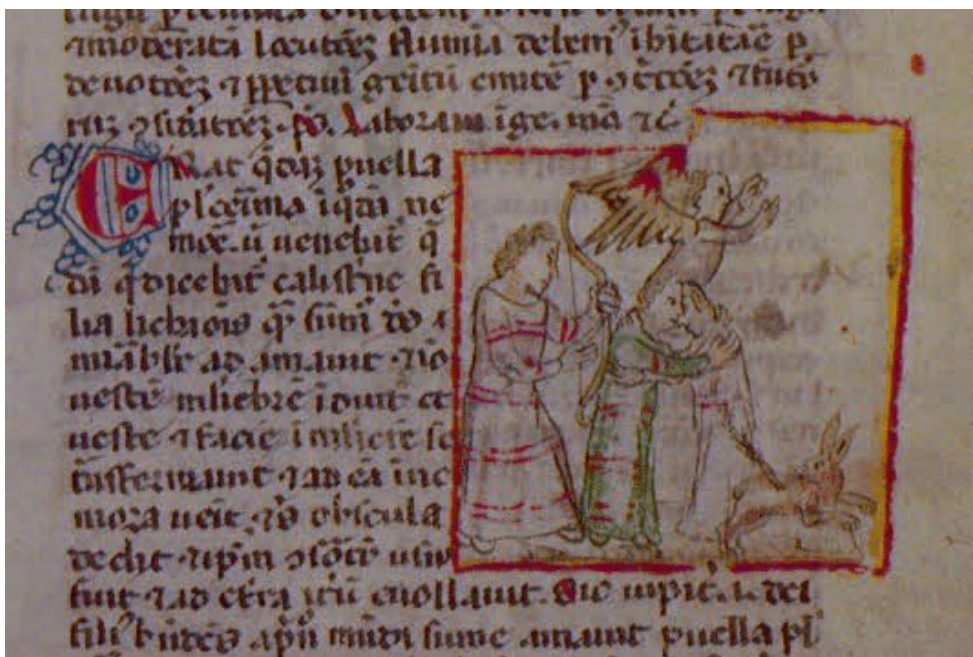
Abb. 17 Detail Jupiter und Kallisto, Bergamo, Biblioteca Civica, Ms. Cassaforte 3.4, fol. 22r.