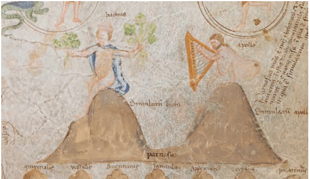
Abb. 9 Paolo da Perugia, Detail Bacchus und Apoll auf dem Parnaß, London, British Library, Cod. Add. 57529, fol. 6r.