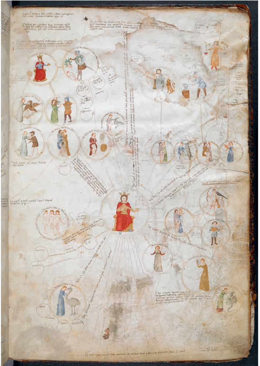
Abb. 6 Paolo da Perugia, Diagramm zu Jupiter, London, British Library, Cod. Add. 57529, fol. 4r.