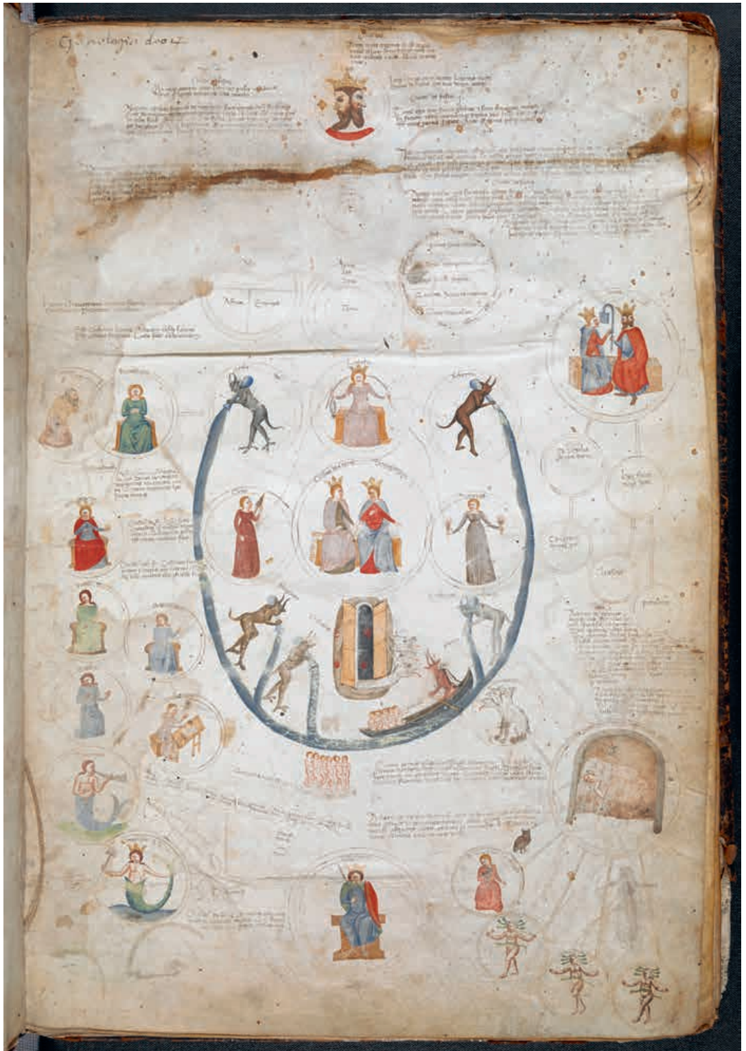
Abb. 3 Paolo da Perugia, Diagramm zu Tellus und Demogorgon, London, British Library, Cod. Add. 57529, fol. 2r.