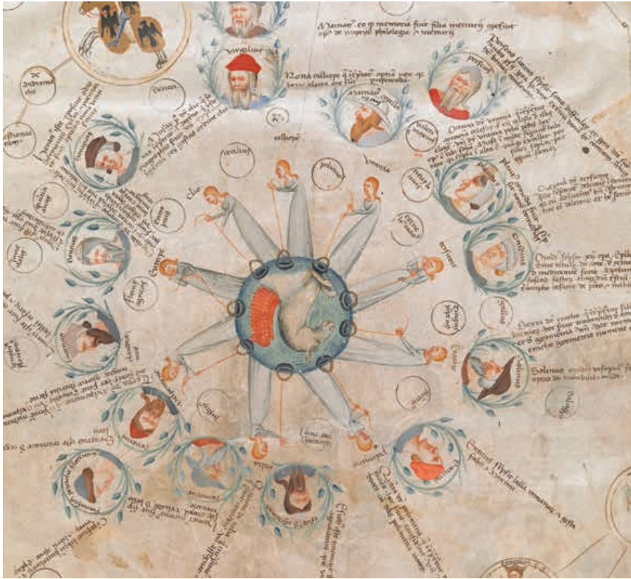
Abb. 7 Paolo da Perugia, Detail Musen, London, British Library, Cod. Add. 57529, fol. 5r.