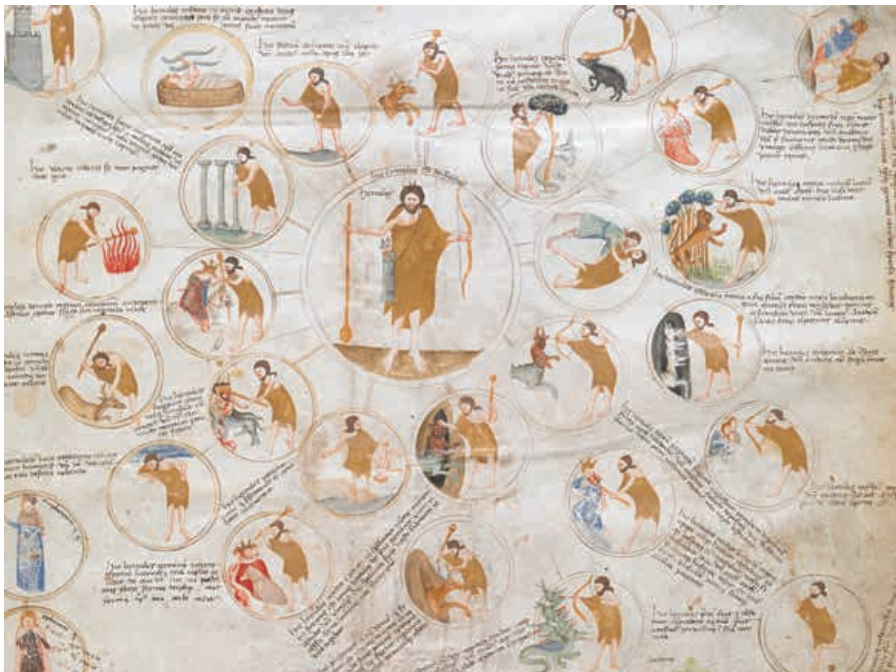
Abb. 8 Paolo da Perugia, Detail Herkules, London, British Library, Cod. Add. 57529, fol. 6r.