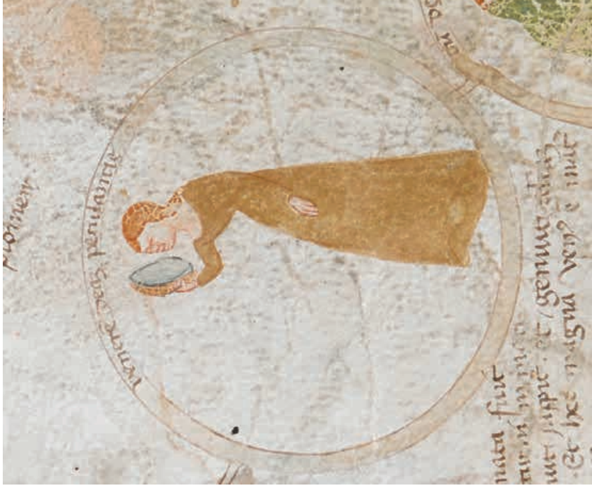
Abb. 11 Paolo da Perugia, Detail Diana, London, British Library, Cod. Add. 57529, fol. 5v.