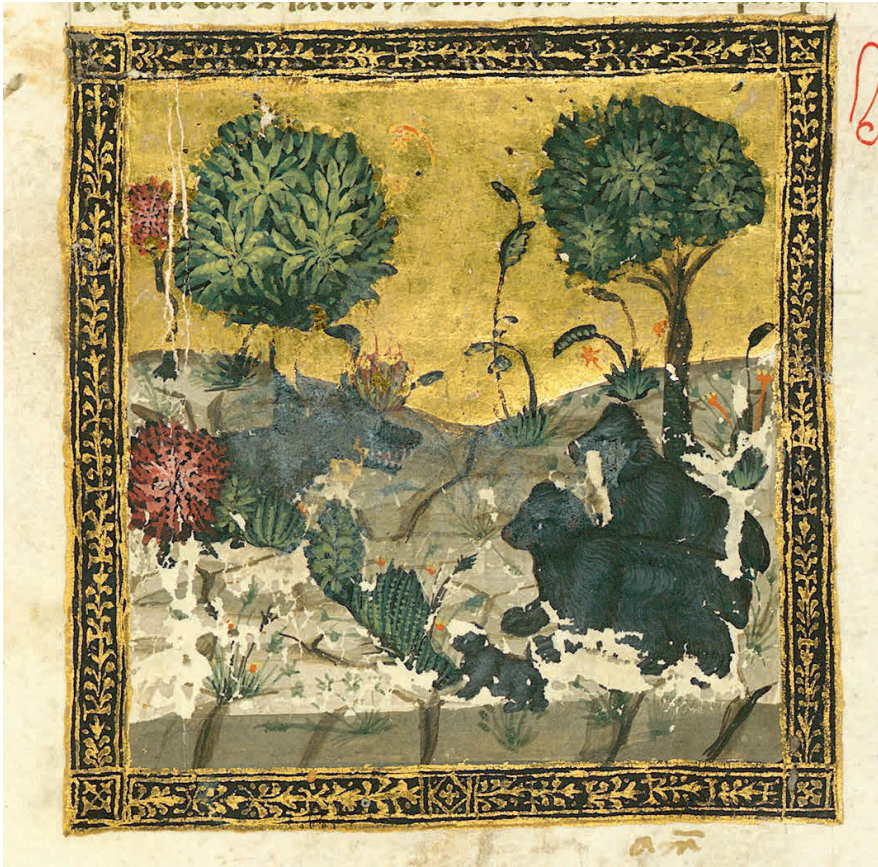
Abb. 16 Detail Lykaon und Kallisto, Gotha, Forschungsbibliothek, Ms. Membr. I 98, fol. 15r.