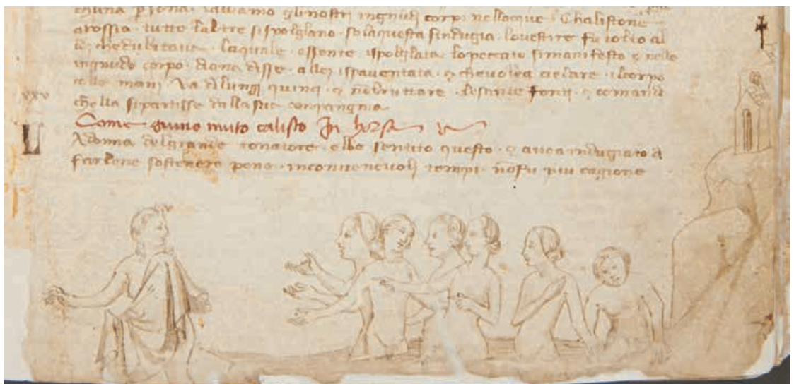
Abb. 22 Verstoßung der Kallisto, Florenz, Biblioteca Nazionale Centrale, Ms. Panc. 63, fol. 20r.