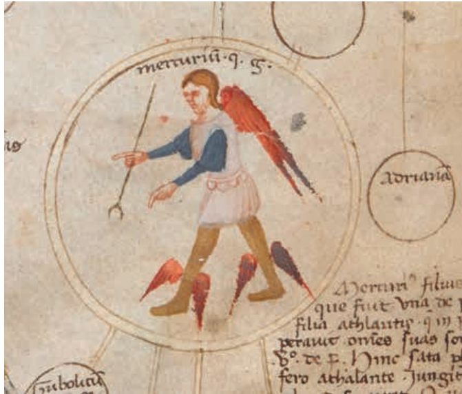
Abb. 13 Paolo da Perugia, Detail Merkur, London, British Library, Cod. Add. 57529, fol. 4v.