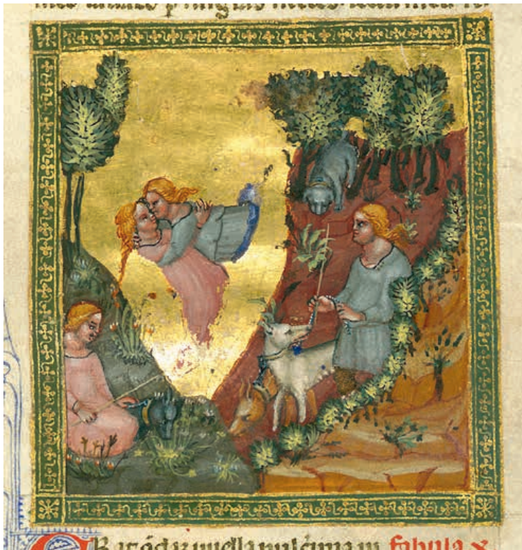
Abb. 14 Detail Jupiter und Kallisto, Gotha, Forschungsbibliothek, Ms. Membr. I 98, fol. 14r.