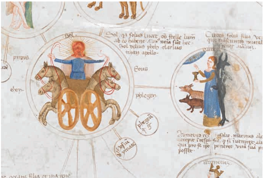
Abb. 10 Paolo da Perugia, Detail Sol-Apollo, London, British Library, Cod. Add. 57529, fol. 5v.